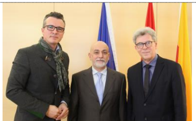
Vereidigung Troia

Bilder von der Eröffnung finden Sie hier .