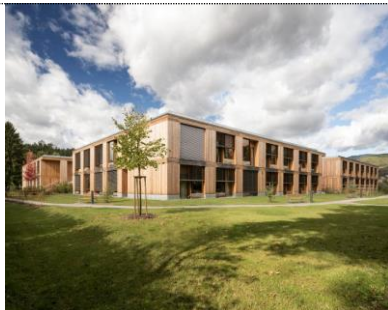
Preisträger: Pflegewohnheim Erika Horn, Graz Architektur: Dietger Wissounig Architekten