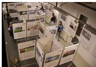
Ausstellung in Bad Radkersburg