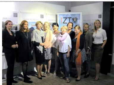
Finissage in Klagenfurt