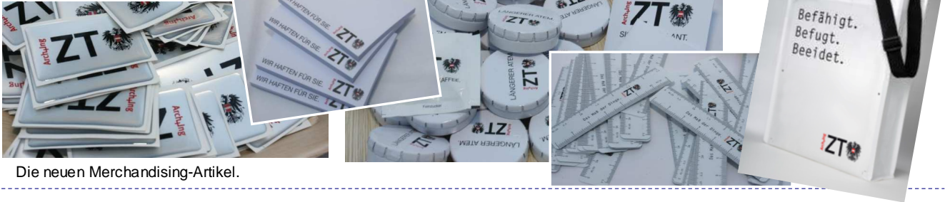
Die neuen Merchandising-Artikel.